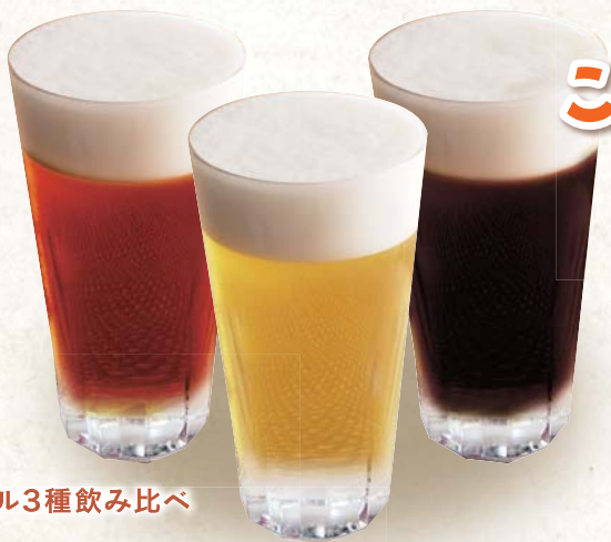
ビール3種飲み比べ