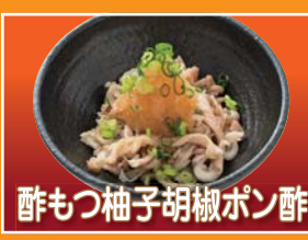
酢もつ柚子胡椒ボン酢 Vinegar giblets with citrus soy sauce