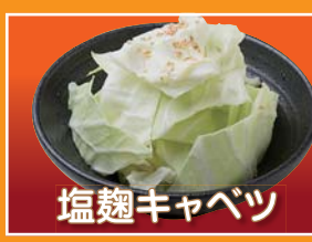
塩麹キャベツ Cabbage with salty sauce