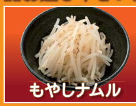
もやしナムル Bean sprout salad