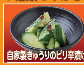
自家製きゅうりのピリ辛漬け Cucumber pickles

4種類の中から1品お選び下さい。 Please choose an à-la-carte dish